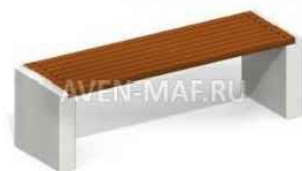
ООО "Авен" С-72/1