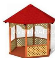
ООО "Авен" Ш-3