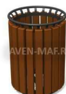
ООО "Авен" У-206